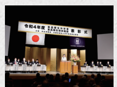
食品衛生功労者表彰式