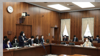
〈女性デジタル人材の育成〉野田聖子大臣、牧島かれん大臣(ともに当時)と質疑