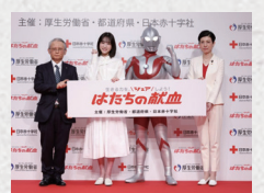
はたちの献血キャンペーン