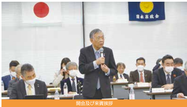
開会及び来賓挨拶

次に薬剤師国会議員の逢坂誠二衆議院議員、神谷政幸参議院議員よりお祝いの挨拶をいただいた。本田顕子参議院議員は公務のため関野秘書よりメッセージが