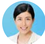
参議院議員・薬剤師 本田顕子