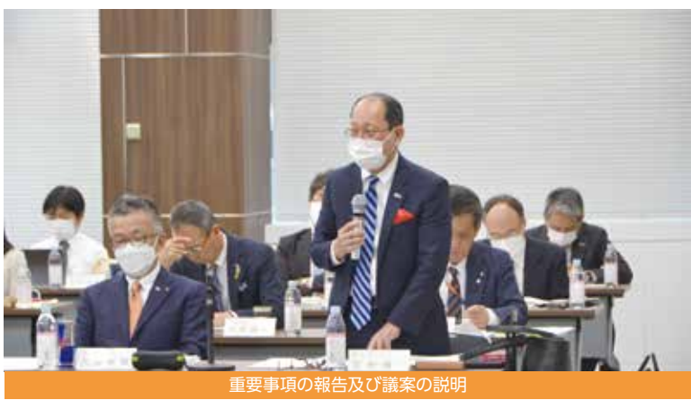
重要事項の報告及び議案の説明