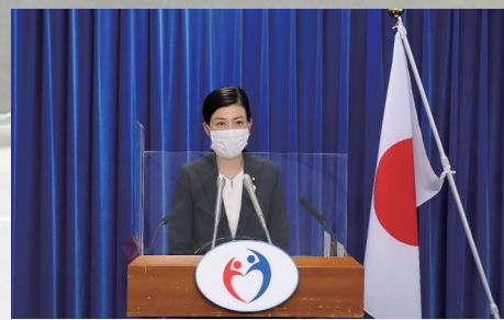
医療、子育て支援、ワクチン接種推進を担当