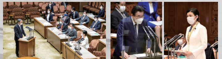
菅義偉総理、後藤茂之大臣(ともに当時)と質疑