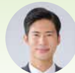
参議院議員・薬剤師 神谷政幸