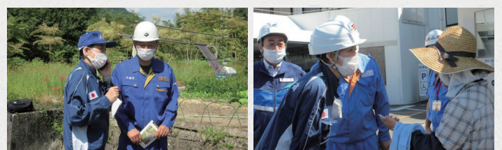
台風15号被災地視察