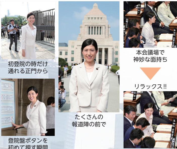
初登院の時だけ通れる正門から