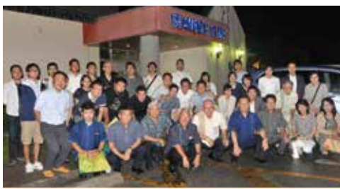
沖縄県 沖縄県若手薬剤師フォーラム(6月6日)