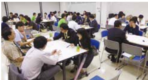
茨城県 茨城県若手薬剤師フォーラム(7月5日)