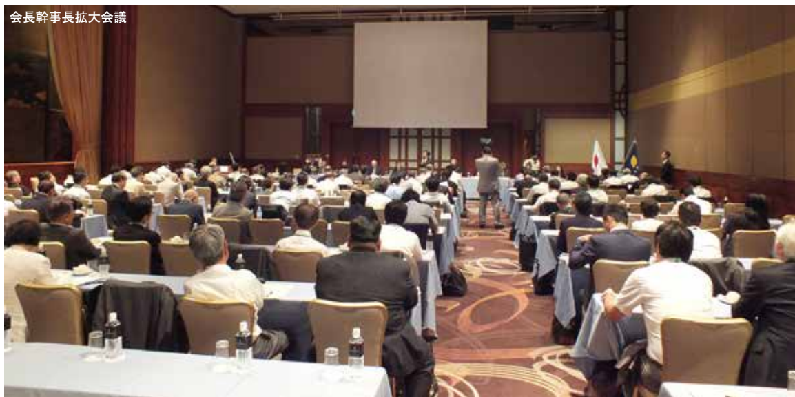
会長幹事長拡大会議

厚生労働大臣は、「患者のための薬局ビジョン」を年内に策定して、五万七千の薬局すべてを患者本位の「かかりつけ薬局」に再編すると表明している。敷地内・施設内薬局は「かかりつけ薬局」としての機能を果たせないことは自明であること述べ、これまでの都道府県薬剤師連盟において陳情活動を行って戴いたことに対して感謝の言葉を述べた。