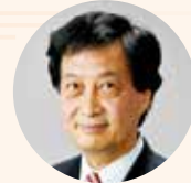
薬剤師・薬学博士 前文部科学副大臣・参議院議員 藤井もとゆき